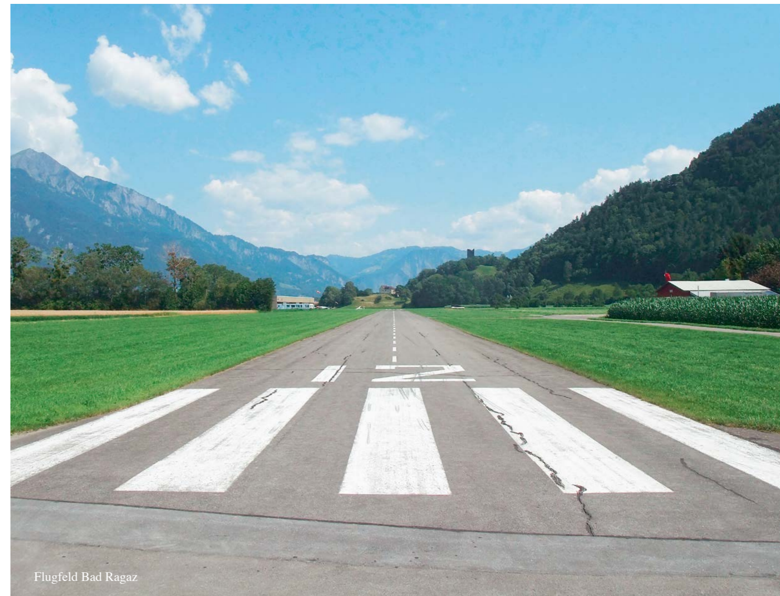
Flugfeld Bad Ragaz

AOPA Switzerland est avec 78 autres AOPA organisations nationales, membre de l'association internationale IAOPA, qui est un représentant permanent auprès de l'Organisation de l'Aviation Civile International (OACI). www.aopa.ch